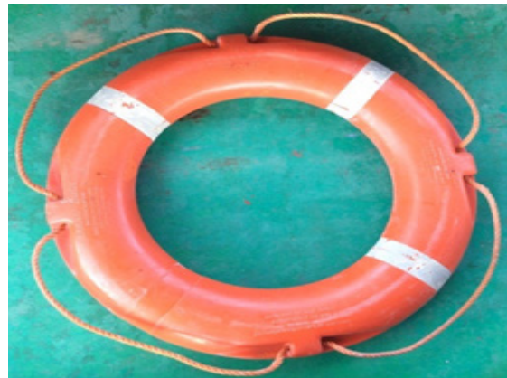
آگ بجھانے والا آلہ