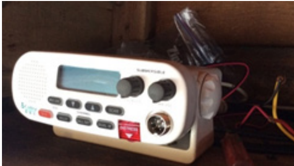
آگ بجھانے والا آلہ