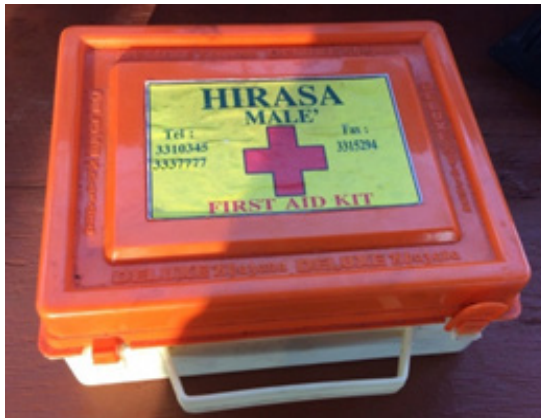
پہلے مدد کے آلہ