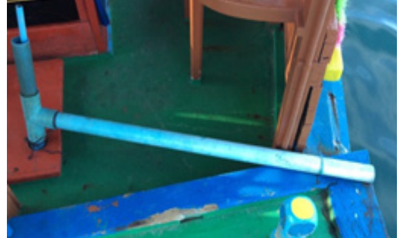
آگ بجھانے والا آلہ